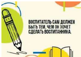
Рис. П2.2. Пример карточки с цитатой