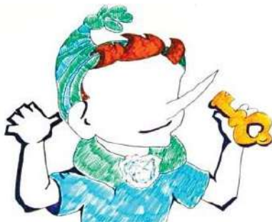
Рис. П2.3. Пример «Буратино»